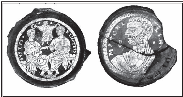
6 a i b. Dva rimska biskupa u periodu progona, Sikst II (257–258), koji je proglašen martirom za vreme cara Valentinijana, i Marcellin (296–304), koji se navodno odrekao vere tokom Dioklecijanovih progona

novog biskupa; a kada su se progoni obnovili pod Aurelijanom i Dioklecijanom – „najsistematičnijem pokušaju uništenja hrišćanstva koji je rimska država ikad videla” – hiljade hrišćana, uključujući i samog papu Marcelina, odreklo se vere i crkve. Pod ovim okolnostima Rimska crkva je morala mnogo toga da učini da bi preživela. To nije bilo vreme za doktrinarne sporove ili iznošenje u javnost teorijskih tvrdnji o poziciji posebnog autoriteta, već pre za jedinstvo pred licem spoljnog neprijatelja.