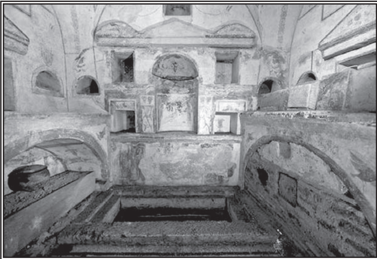
5. Grobnica iz 2. veka, otkrivena u skorijim otkopavanjima ispod Bazilike Svetog Petra u Rimu, gde je, po predanju, Sveti Petar bio sahranjen

Svetog Pavla na Ostijskom putu, autentičan ili ne, nema sumnje da je ta telesna bliskost s Petrom bila prednost koju je rimski biskup mogao da eksploatiše ako bi se ukazala potreba za tim. Upravo se to i desilo tokom trećeg veka kada su pitanja, kao što su slavljenje Uskrsa i oprost grehova, vodila do žestokih doktrinarnih kontroverzi. Argumenti koje su Irinej i Tertulijan nekad upotrebljavali protiv sekta, sada su bili okrenuti ka drugim crkvama.